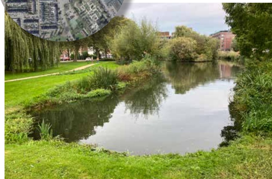
De hoek van de singel bij de Coosje Ayalstraat.