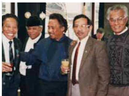
Receptie na het verkrijgen van de Rietkerkpenning.

niseerde ook bijeenkomsten voor christen- en moslimmolukkers om de rust te bewaren in Nederland.