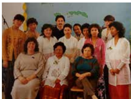
Opening stichting Madju

In 2000 werd de landelijke vereniging Vrouwen voor Vrede op de Molukken opgericht. Deze vereniging bestaat uit protestanten, katholieken en islamitische vrouwen. Op de Molukken waren er op dat moment gewelddadigheden tussen de verschillende geloven. Hier wilde men iets aan doen. Door de organisatie werden vredesweekenden georganiseerd en stille tochten om aandacht te vragen voor de situatie op de Molukken. Men orga-