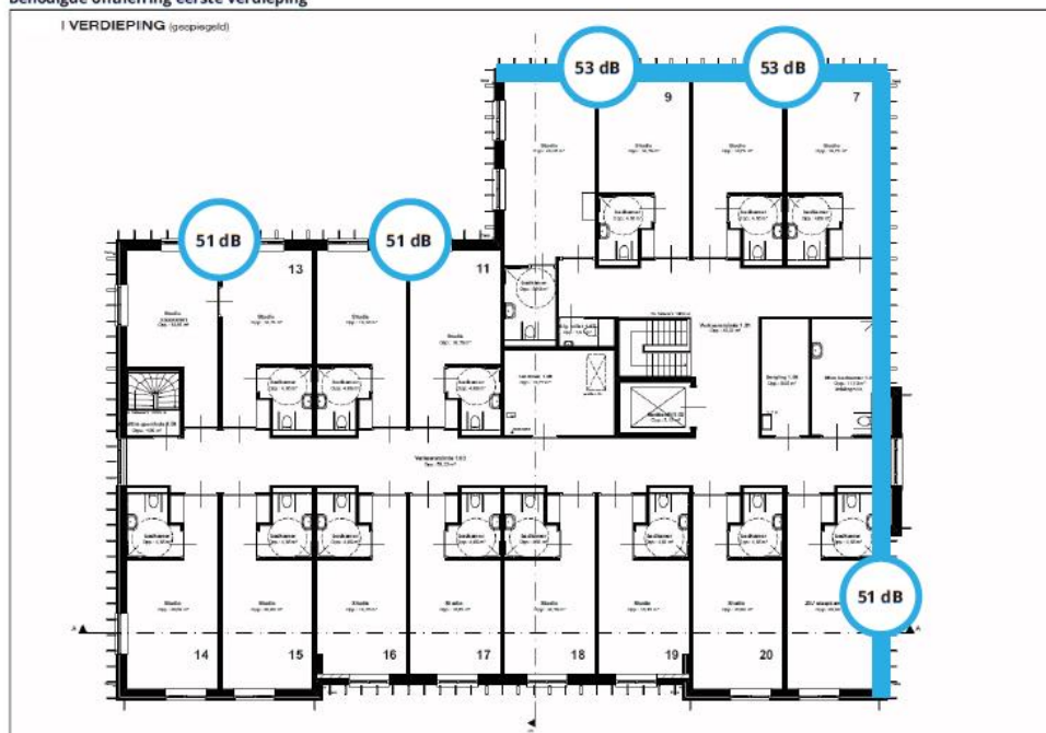
Figuur 4. Hogere grenswaarden (incl. 2 dB correctie ex. art. 110g Wgh) als gevolg van de Rijksweg A15, op de eerste woonlaag.