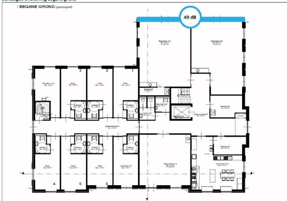
Figuur 3. Hogere grenswaarden (incl. 2 dB correctie ex. art. 110g Wgh) als gevolg van de Rijksweg A15, op de begane grond.