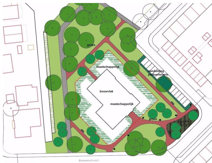
Figuur 2: de beoogde situatie van WoZoCo aan de Anjerstraat in Ridderkerk