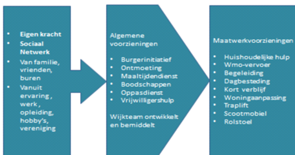
Figuur 2 Samenhangend antwoord met en voor de inwoner

Omdat vaak helder is dat problemen samenhangen wil de gemeente Ridderkerk bij het zoeken naar oplossingen verbindingen leggen. Als de oplossingen buiten het directe domein van de gemeente of