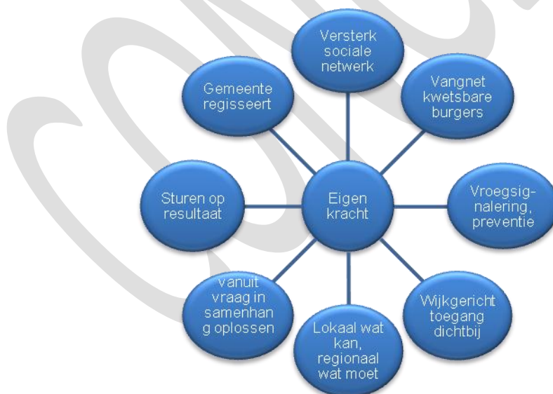
Figuur 1 De Kanteling

We werken resultaat- en oplossingsgericht samen. De oplossing voor de burger staat voorop. De vraag van de inwoner staat dus centraal: eerst kijken we samen naar wat er nodig is. We zoeken antwoorden op alle levensterreinen: opvoeden en opgroeien, werk, onderwijs en welzijn, meedoen, veiligheid, begeleiding, wonen, inkomensondersteuning, e.d. Samen stellen we vast welk resultaat we willen bereiken. We kijken niet langer eerst naar de beschikbare voorzieningen. Wanneer de laagdrempelige oplossingen in de wijk te weinig bieden, onderzoeken we wat specifiek voor de