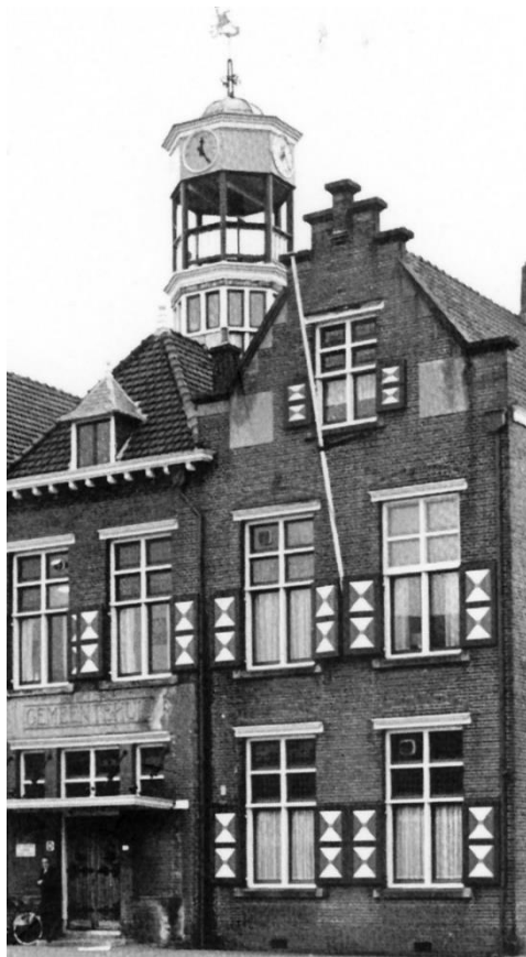
Het gemeentehuis in 1909-1979