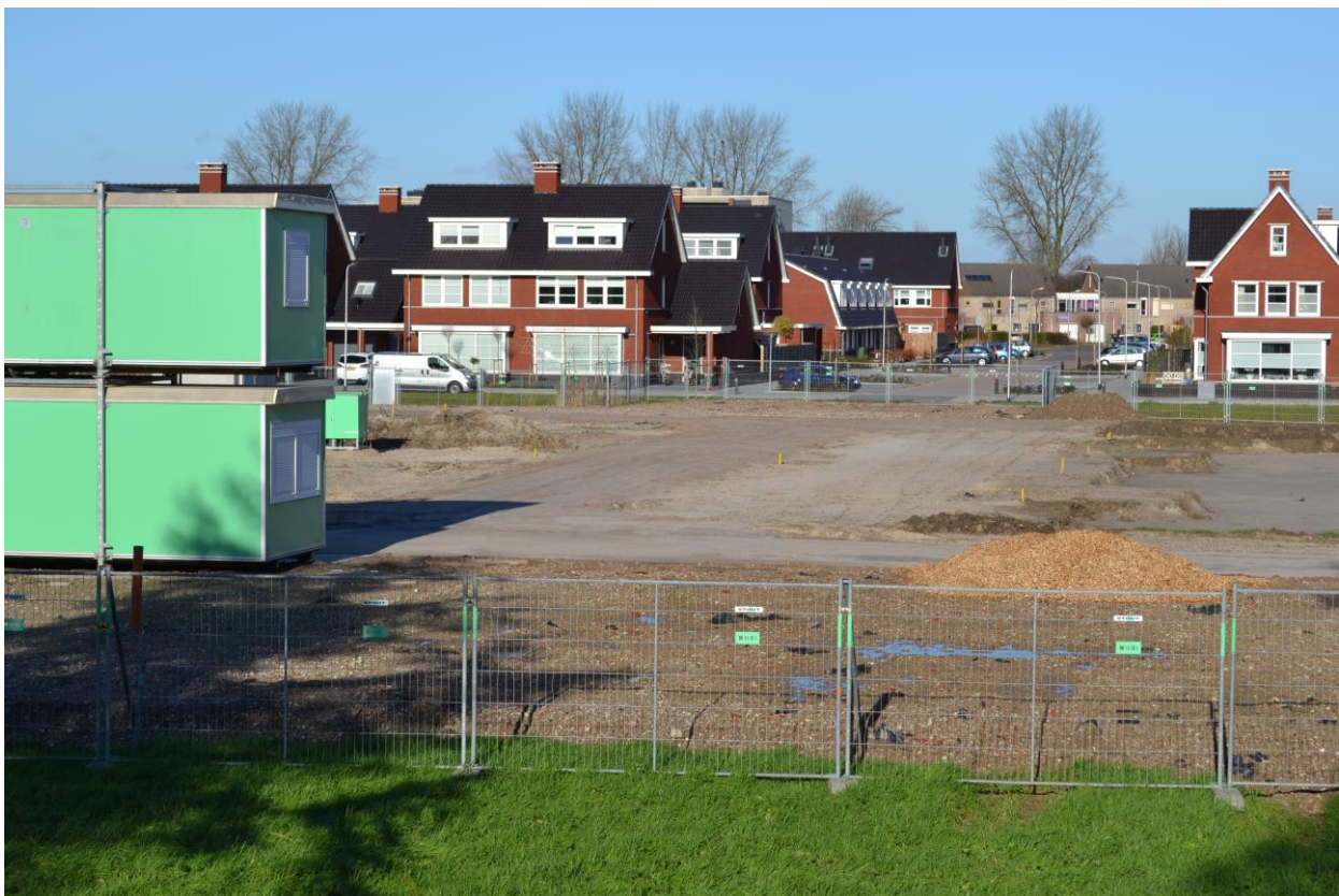
Bouwgrond Het Zand, derde fase