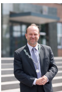
B. Blase, Alblasserdam

De politie treedt bij de handhaving van de openbare orde en bij hulpverlening in een gemeente op onder gezag van de burgemeester. Bij strafrechtelijke handhaving staat de politie onder gezag van de (hoofd)officier van justitie. De politiefchef is belast met de dagelijkse aansturing van de politie-eenheid. De burgemeesters binnen de regio en de hoofdofficier van justitie bepalen samen met de politiefchef de prioriteiten voor de politie, verdelen de politiesterkte over de onderdelen van de politie-eenheid en stellen jaarlijks het jaarverslag van de politie vast. Ook voeren zij het beheer over de gezamenlijke veiligheidsvoorzieningen, zoals het Regionaal Informatie- en Expertisecentrum (RIEC), Veiligheidshuizen en de VeiligheidsAlliantie regio Rotterdam (VAR). Zij komen bijeen in het Regionaal Veiligheidsoverleg (RVO) onder voorzitterschap van de regioburgemeester.