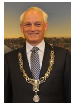
C.H.J. Lamers Schiedam