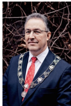
A. Aboutaleb, Rotterdam/ regioburgemeester