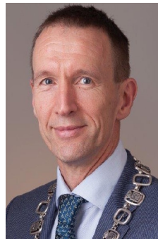
E. van Heijningen Hellevoetsluis