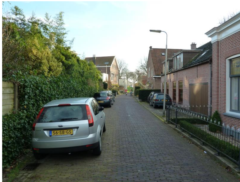
Molensteeg gezien naar de Molendijk