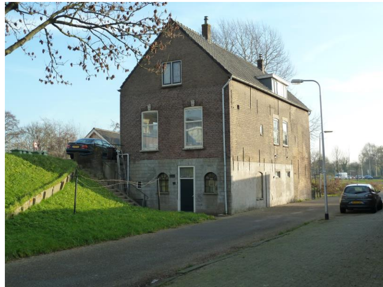
Westmolendijk 16,18, gezien vanaf de Molensteeg