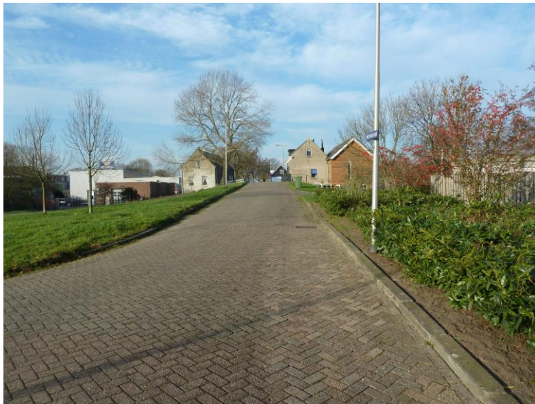
De 'kop' van de Westmolendijk met rechts Westmolendijk 97