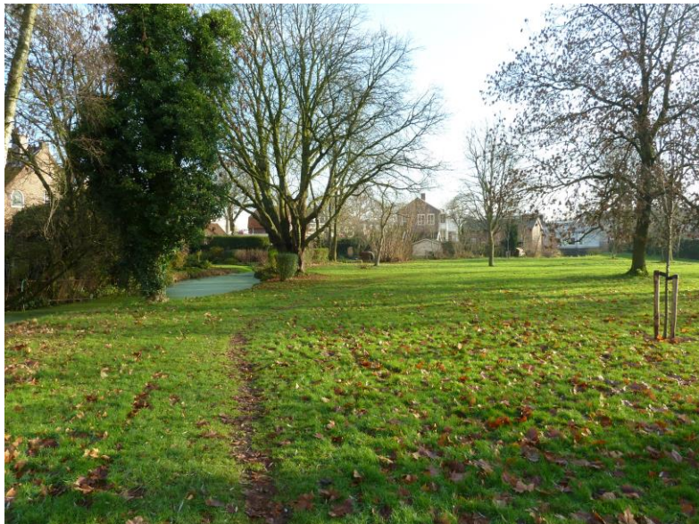
Park, met links de watergang en de achtergevels van de bebouwing Molensteeg