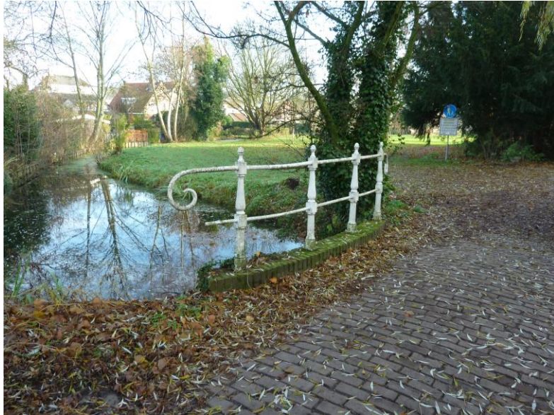
Entree park via historische brug over watergang