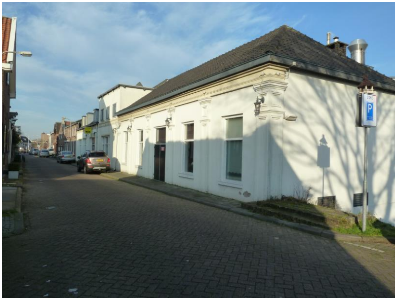
Westmolendijk met links Molensteeg