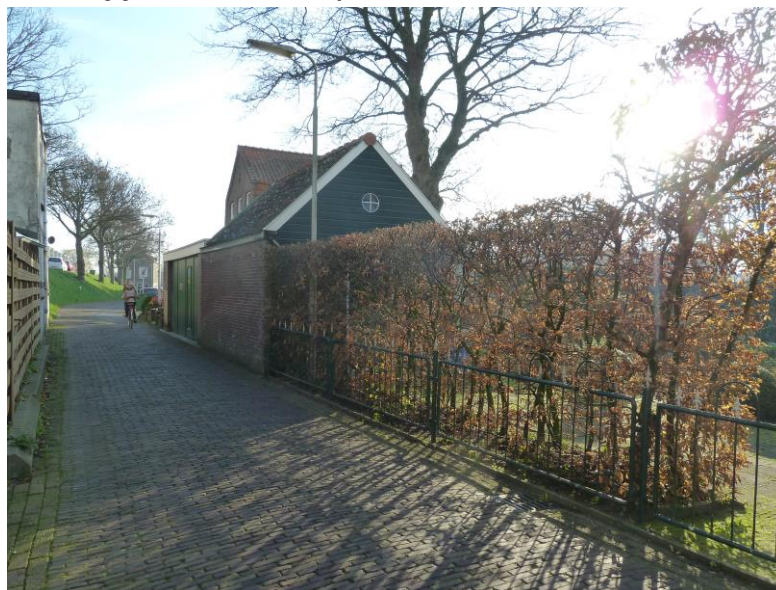
Molensteeg, met doorkijk naar park