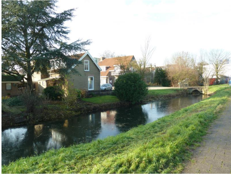
Molensteeg 34, 36 met links nr. 34, rechts Westmolendijk 16,18