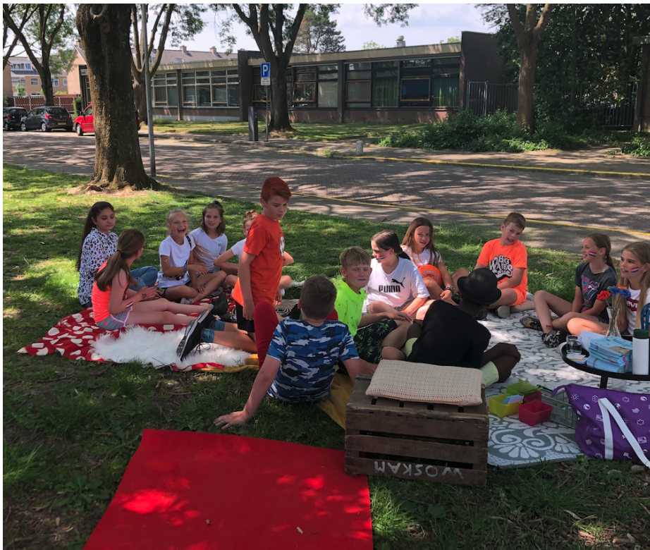
De rode loper lag uit voor onze Vips