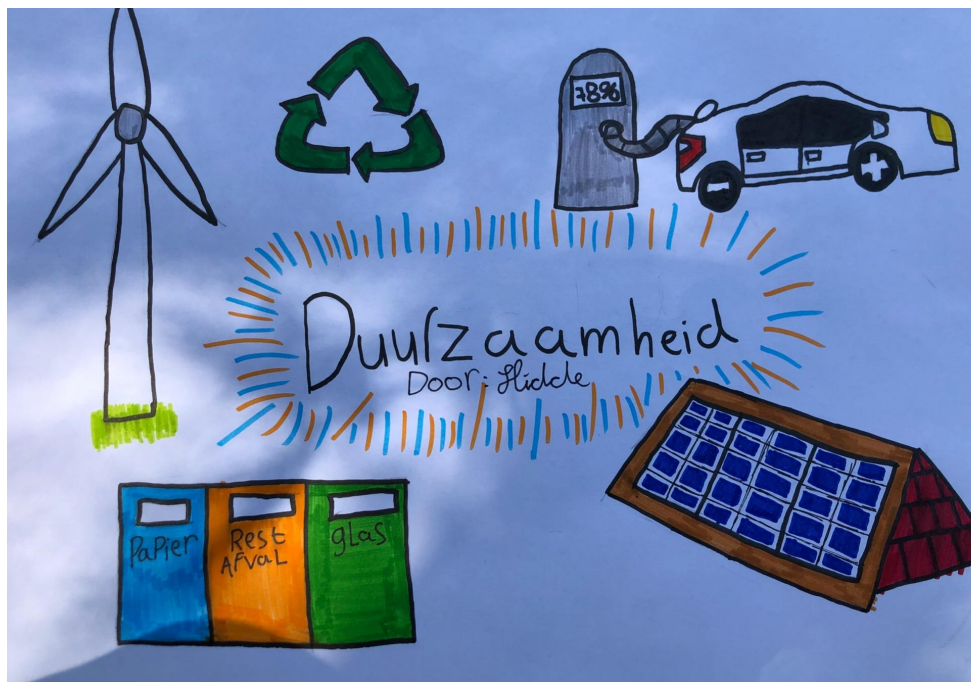
een tekening gemaakt door één van de deelnemers