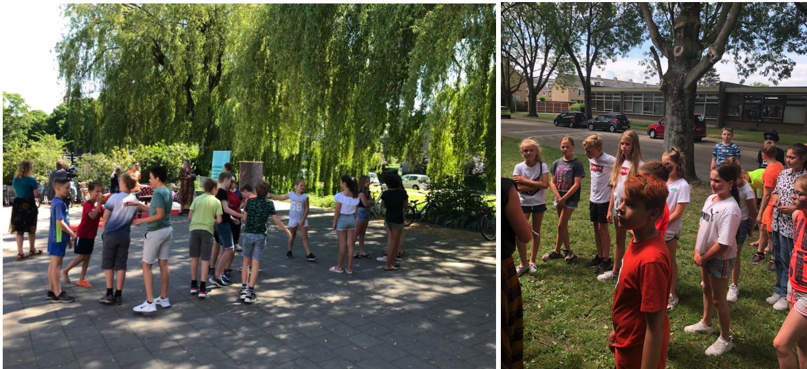
impressie van Jong Ridderkerk On Tour