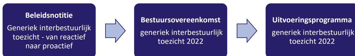
Figuur 1 van beleidsnotitie tot uitvoeringsprogramma

In 2020 is het interbestuurlijk toezicht in Zuid-Holland mede op basis van de input van de gemeenten geëvalueerd. Na de evaluatie organiseerde de provincie ambtelijke sessies en een bestuurlijke bijeenkomst met de gemeenten. De uitkomsten van de evaluatie en de input van de gemeenten zijn verwerkt in de Bestuursovereenkomst en betrokken bij de totstandkoming van dit Uitvoeringsprogramma. De Bestuursovereenkomst vormt de fundering voor het Uitvoeringsprogramma. Dit Uitvoeringsprogramma treedt in werking op 1 januari 2022 en blijft voor onbepaalde tijd van kracht totdat Gedeputeerde Staten hebben besloten tot de wijziging ervan. Het Uitvoeringsprogramma bevat informatie over: