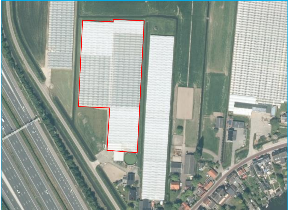
Afbeelding 1: Situering plangebied.

Het plangebied is gelegen in het buitengebied van Ridderkerk en betreft een kas (9.954m 2 ).