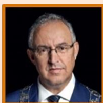
Burgemeester A. Aboutaleb, Voorzitter Coördinerend bestuurder

Zes leden uit het Algemeen Bestuur vormen het Dagelijks Bestuur. Het Dagelijks Bestuur is belast met de voorbereiding en uitvoering van de besluiten die het Algemeen Bestuur neemt. Ieder lid van het Dagelijks Bestuur heeft zijn / haar eigen portefeuille. Hieronder is de samenstelling van het Dagelijks Bestuur opgenomen.