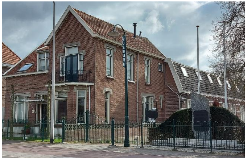
Woonhuis gezien vanaf de Rijksstraatweg. Rechts herdenkingsmonument voor de capitulatie