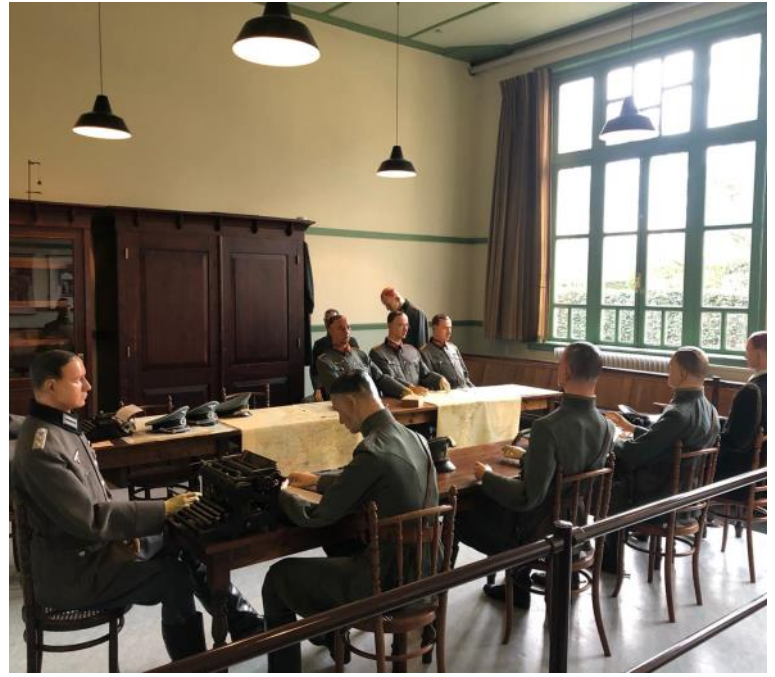
Interieur schoolgebouw.