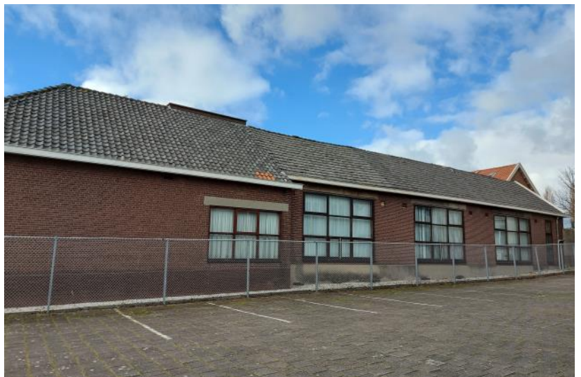
Achtergevel school, met links aanbouw uit 1939