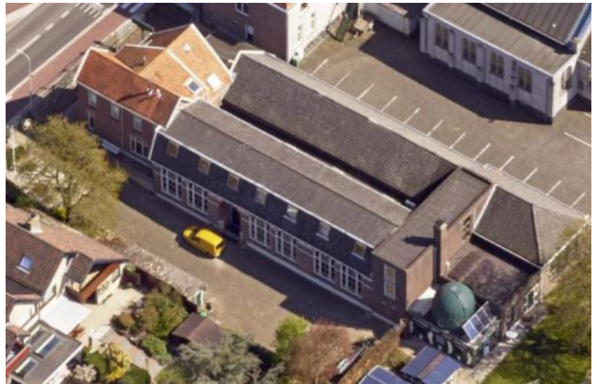
Woonhuis met achtergelegen school.