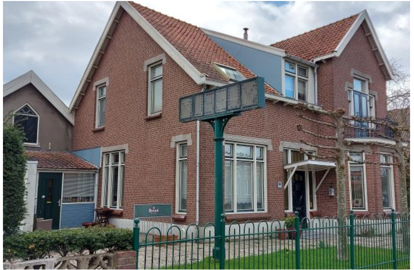
Voorgevel en linker zijgevel woonhuis