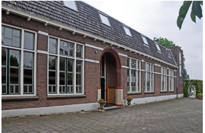
Voorgevel school.