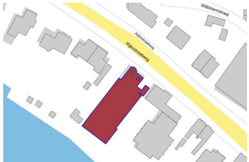
Kadastrale situatie.