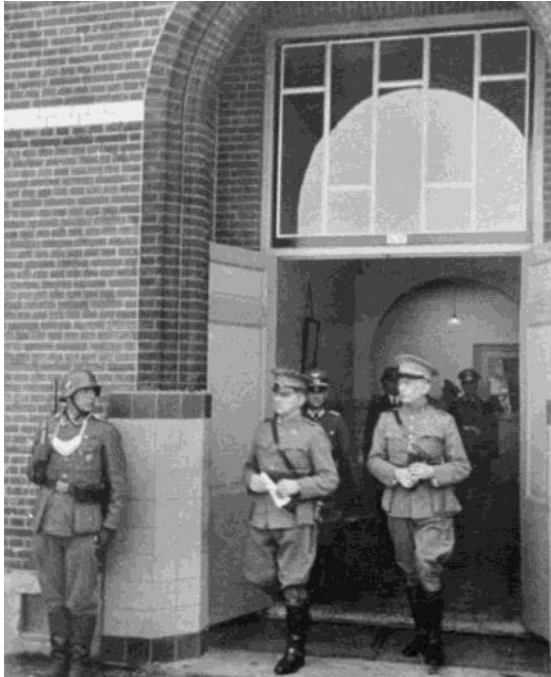
Generaal Winkelman verlaat het schoolgebouw na het tekenen van de capitulatie op 15 mei 1940.