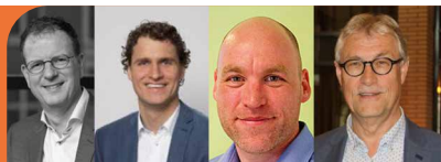
AMBASSADEURS PRESENT RIDDERKERK

Een prachtige groep mensen die zich ook in 2019 weer aan ons heeft verbonden als ambassadeur. Deze mensen draagt Ridderkerk een warm hart toe en zijn elk op hun eigen manier betrokken bij Present. Ze zetten concreet hun kennis en netwerk in om de stichting te ondersteunen en naamsbekendheid te vergroten. Wij zijn blij dat deze mensen verbonden zijn met Present.