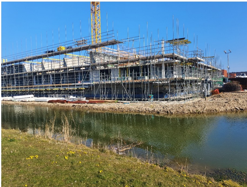
Appartementencomplex fase 6 in aanbouw (maart 2022)

Sinds 2014 zijn er 176 eengezinswoningen opgeleverd in Het Zand (eerste fase 34, tweede fase 30, derde fase 39, vierde fase 23, vijfde fase 50). Van de zesde zijn de 37 grondgebonden woningen bijna gereed. Het appartementencomplex (58 app.) is in aanbouw. De 7 e fase is gegund aan Ontwikkelbedrijf Knarrenhof 8 B.V. voor de bouw van 27 woningen.