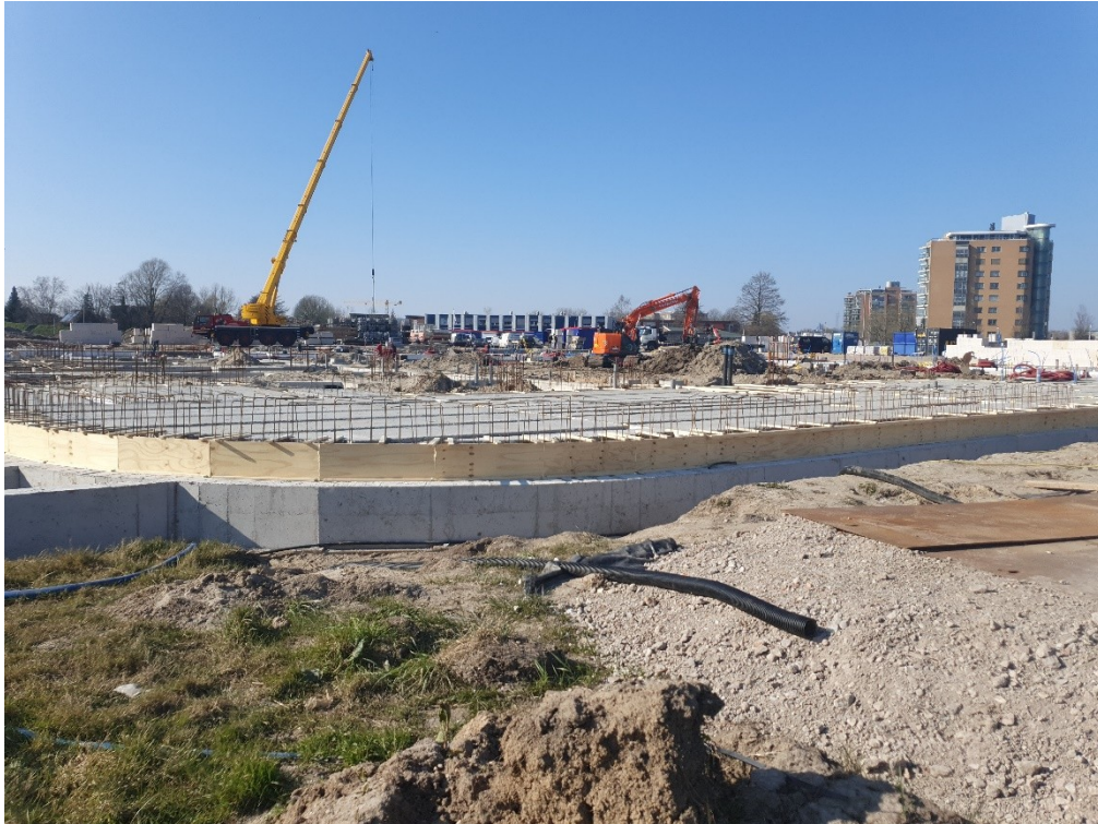
Het eerste van drie bouwblokken in Driehoek Het Zand in aanbouw (maart 2022)