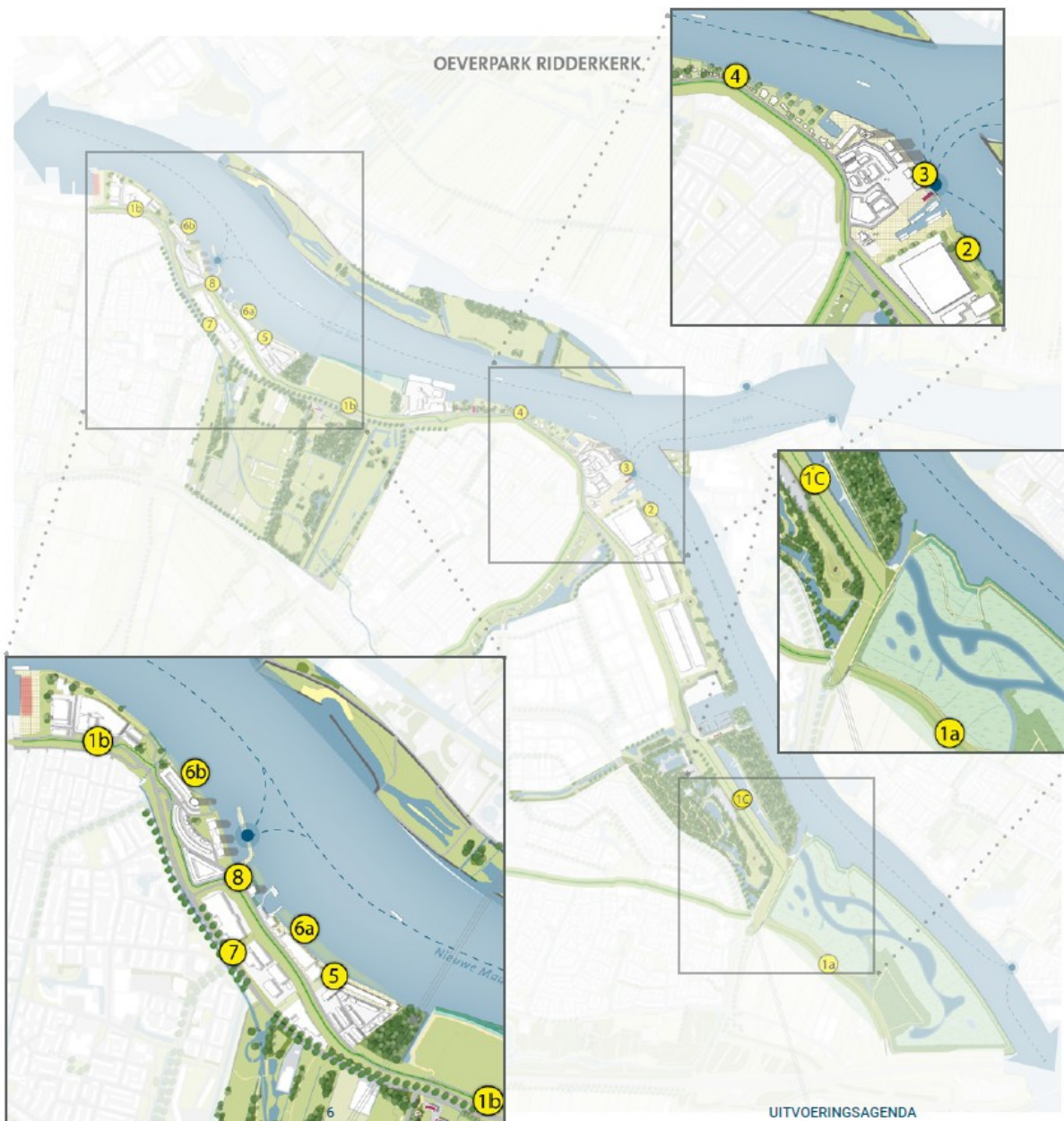
Figuur 4 - Projecten uitvoeringsagenda Rivieroevers

In de figuur 4 zijn de locaties van de projecten terug te vinden.