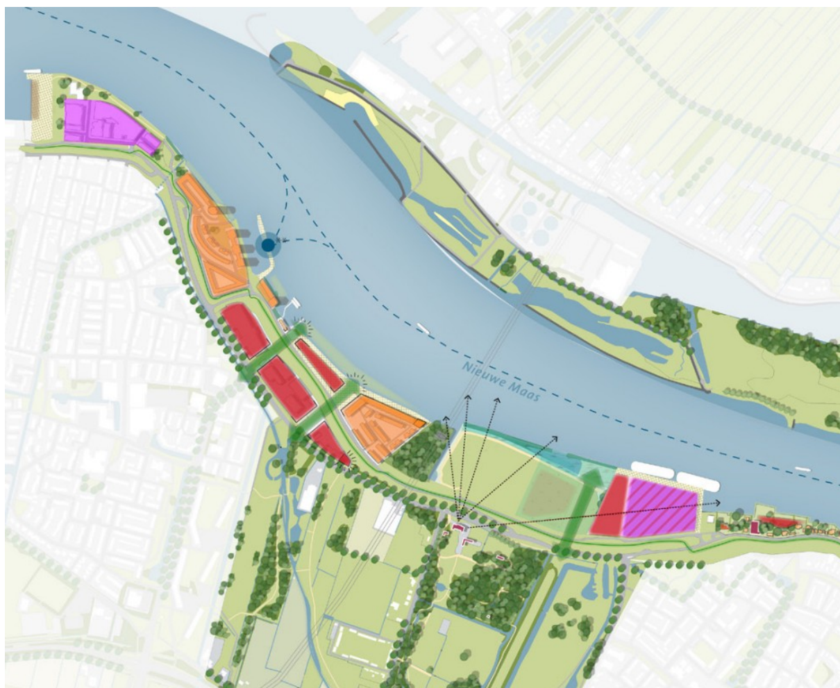
Figuur 3 - Gebiedsvisie Rivieroevers, omgeving Bolnes tot en met Schiepolocatie