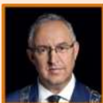
Burgemeester A. Aboutaleb, Voorzitter Coördinerend bestuurder

Zes leden uit het Algemeen Bestuur vormen het Dagelijks Bestuur. Het Dagelijks Bestuur is belast met de voorbereiding en uitvoering van de besluiten die het Algemeen Bestuur neemt. Ieder lid van het Dagelijks Bestuur heeft zijn / haar eigen portefeuille. Hieronder is de samenstelling van het Dagelijks Bestuur opgenomen.