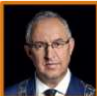
Burgemeester A. Aboutaleb, Voorzitter Coördinerend bestuurder

Zes leden uit het Algemeen Bestuur vormen het Dagelijks Bestuur. Het Dagelijks Bestuur is belast met de voorbereiding en uitvoering van de besluiten die het Algemeen Bestuur neemt. Ieder lid van het Dagelijks Bestuur heeft zijn / haar eigen portefeuille. Hieronder is een overzicht van het Dagelijks Bestuur opgenomen.