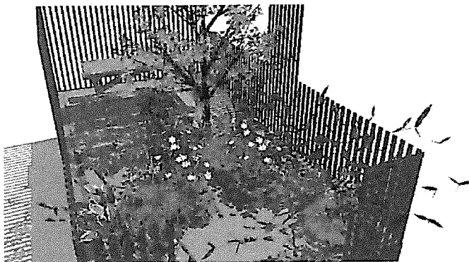
Schets van de pop-up-tuin

Een ander project is de 'pop-up-container'. Deze container is een verplaatsbare tuin met een bankje, die de aandacht trekt op plekken waar veel mensen komen, zoals bij winkels of tijdens evenementen. In de tuin kan men het gesprek aan gaan over vergroenen en tips krijgen. De verwachting is dat de pop-up-tuin vanaf juni inzetbaar is.