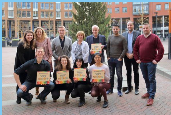
Foto tekenmoment partners