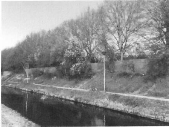
Geluidsschermbank bij Drievliet