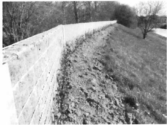
Geluidsschermbank bij het Zand

Hoogachtend, het college van burgemeester en wethouders van Ridderkerk,