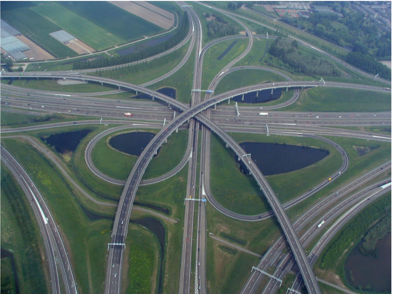
Knooppunt Ridderkerk, van west naar oost