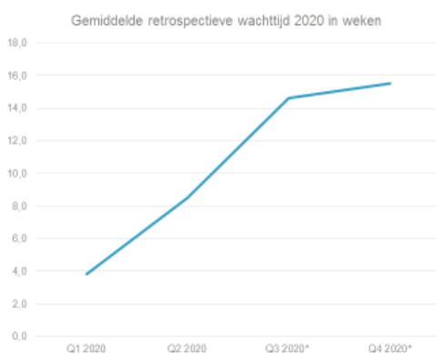
Tabel 1. Huidige wachttijd Q4 2020 - alle gemeenten